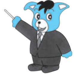
国民年金マスコット ハッピーちゃん