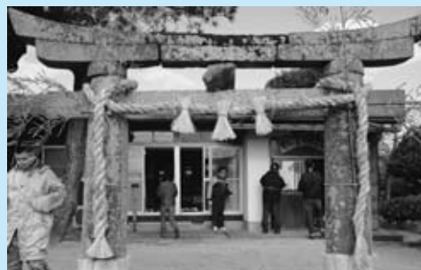
▲むら祭りの準備（地区公民館）

また、地区住民間の親睦を目的として、子どもクラブの焼き肉会や敬老会も実施されていて、長年にわたる行事として定着しています。