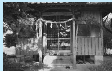
▲野寄天満宮のしめ縄飾り

天神様を氏神とし、毎年 12 月 25 日に村祭りを行います。23 日の天皇誕生日には、施主を中心にしめ縄作りをしています。地区は、明治より代々続家とその分家筋の住民が多く、団結力の強いのが自慢です。