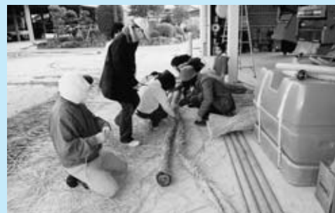
▲子どもクラブ参加のしめ縄作り