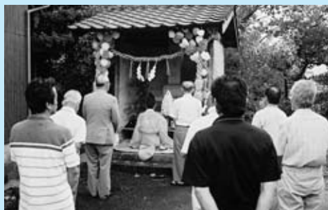
▲信種（のぶたんさん）神社での慰霊祭

また、この地区の南方と伝えられる長者林古戦場で戦死した江上信種を慰霊するため、文政 12 年（1829 年）自得寺で 250 年御忌を行い、位牌を寺内にたて、信種（のぶたんさん）神社が建立されています。昔から地区民が代々祭りをを行い、8 月 18 日には慰霊祭が、今でも江上の子孫代表者を招待して実施されています。