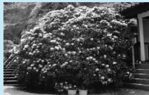
▲最勝寺の石楠花（シャクナゲ）

名所は、清流で水量豊富な荒瀬の滝や、佐賀県の銘木に指定された最勝寺の石楠花があります。石楠花の満開時は見事で、4 月下旬から 5 月上旬が見ごろです。