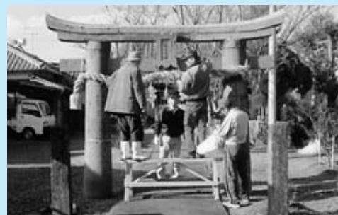
▲御髪神社へのしめ縄飾り