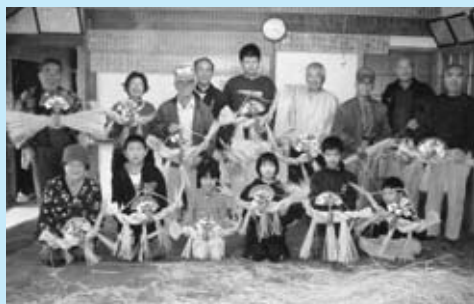
▲世代間交流のしめ飾り作り

小さな地区ですが、まとまりには定評があり、スポーツや最近の農地・水・環境活動にそれが現れています。