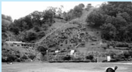
▲自然の傾斜を活かした公園

また、地元で採れた、採れたての新鮮な野菜や物産なども販売しています。お食事もできます。