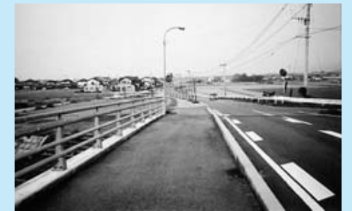
▲ふるさと大橋付近

また、地区周辺の城原川堤防や歩道・農道は、ウォーキングやジョギングなどの快適コースで、楽しむ人が年々増えています。