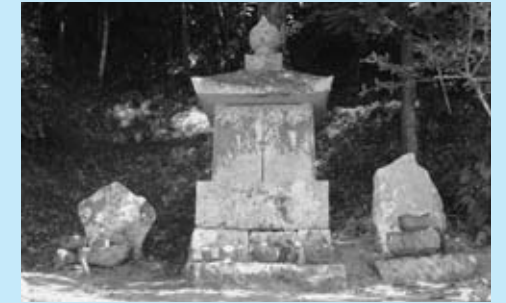
▲祇園祭の観音さん

近年、過疎・高齢化が進んでいますが、地域環境美化活動には、県道・市道・河川等の雑草繁茂期に地区住民総出で草刈りなどに取り組んでいます。