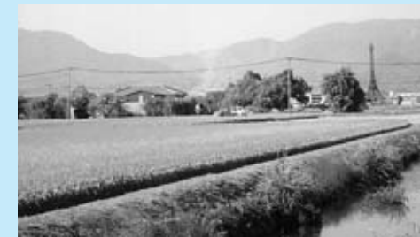
▲エッフェル塔の見える地区

20年前位までは、昔と一緒に、冠水常襲地区でした。今は、近くを佐賀導水が通り改善はされましたが、昔も今も、私たちの地区住民は、水との戦いが生活の一部であって早く、この苦勞が報われる様一同がんばっています。