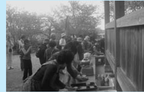
▲菜の花マーチ時のもてなし風景

この神社へ春の菜の花マーチ、秋のJRウオーグの時には、各地より多くの参拝者があります。ひと時の憩いを癒やしてもらうために地区婦人会によるお茶のもてなしをしています。