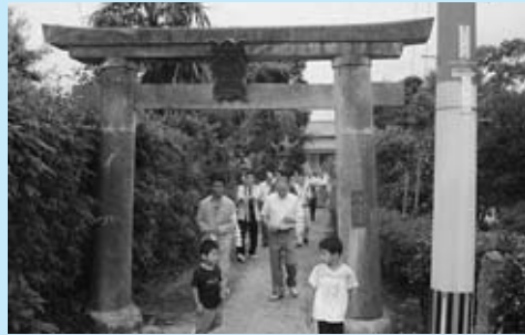
▲「神水かけ」に向かう氏子(嘉納の天満宮)

今後も地区の興隆と繁栄・融和のため、先人の残したお祭りや行事等は守り続けていきたいと思っております。