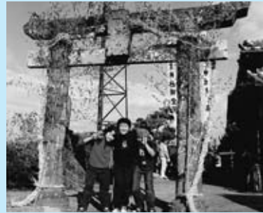
▲しめ縄かざり(若宮神社)

大門地区には農業にまつわる伝統的な行事がいくつか残っています。豊作と安泰を願って、地区の中心部にある若宮神社を昔から大切に祭ってきました。12月上旬には、しめ縄を造り神事を行います。地区住民の親睦を深める行事として今も受け継がれています。