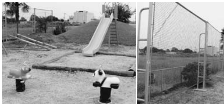
▲遊具、防球ネット整備事業（鶴西地区）