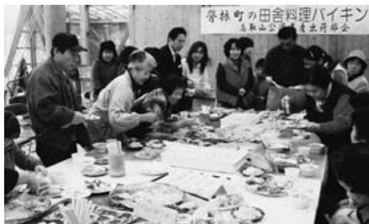
▲今年の「感謝祭」の様子