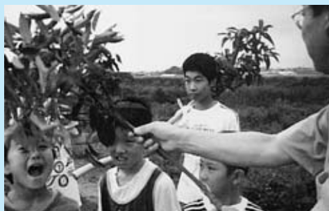
▲ 9 月 7 日に予定されている「お汐井とり」

この行事は、平成 18 年 3 月に千代田町の PR のためテレビで放映されました。