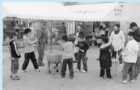
▲再開された「餅つき大会」

餅つき大会を数年前に再開しました。子どもたちとの触れ合いや住民相互の親睦を深めるために、今後とも続けていきたいと思っています。