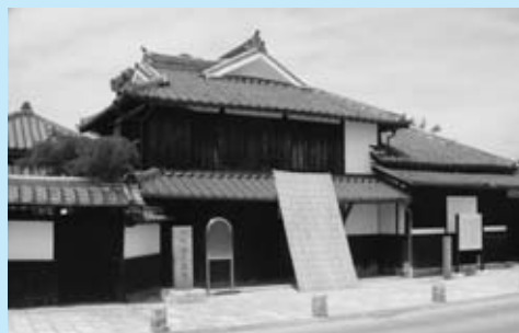
▲ 10 月 3 日には、生誕祭が行われる