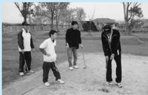
▲次郎の森公園での「ふれあいスポーツ大会」

地区の行事は、毎年 4 月に近くの次郎の森公園で地区民総出のふれあいスポーツ大会を開催しています。また、地区内 3 つの公民館、2 つのお寺で、老人クラブ、婦人会、子どもクラブなど独自の催しも毎月開かれています。