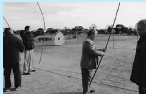
▲横武の百手祭(市重要無形民俗文化財指定)

地区の行事は、市重要無形民俗文化財指定の「百手祭」で、地区内の乙龍神社で奉納され、神官の祝詞の後、東から大的、紙的、菱の順に立てられた的を一人 5 本の矢で射て、豊作や健康など一年の運勢を占います。