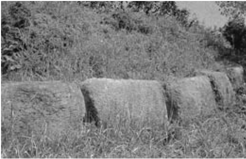
▲帯隈山神籠石の列石

久留米の高良山にある列石が古くから「神籠石」と呼ばれていたため、北部九州から瀬戸内海沿岸に分布する同種の遺跡も「神籠石」と名付けられました。昭和一六年に池の工事中に発見され、昭和二六年六月に国史跡に指定されています。昭和三九年に実施された発掘