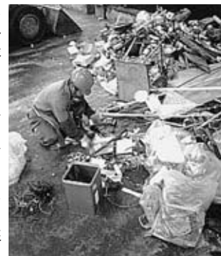
▶脊振クリーンセンターでの選別

脊振クリーンセンターでは、汚れのひどい物や分別が不十分なごみは、人手による選別などの手間をかけて、リサイクル業者に引き渡しています。