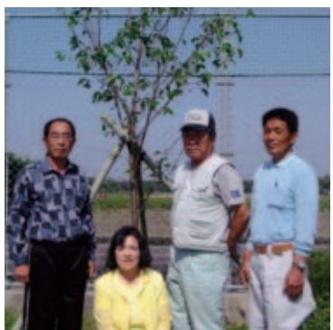
▶(右) 昭和34年卒業生 (左) 昭和36年卒業生