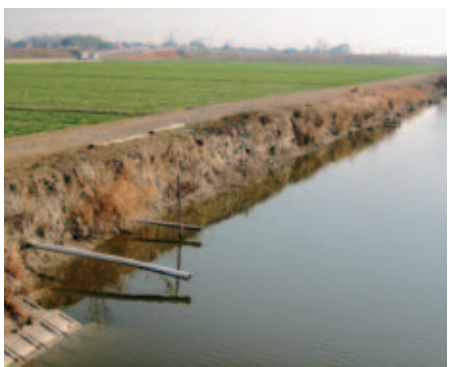
▶南部地域クリークの現状

農業の安定的な発展のため、法落に対する各種の事業を取り組んでいます。法面崩落のスปีドが速く、またクリーク（約170km）の密度の高さから事業の取り組みが追いついていけない状況となっています。