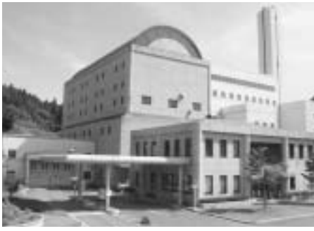
▲脊振広域クリーンセンター

クリーンセンターは、平成8年11月より構成市町内の家庭、事業所から排出される一般廃棄物を適切かつ安全に処理・処分する施設として稼動しています。