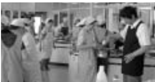
▲おいしいぎょうざができあがっています。