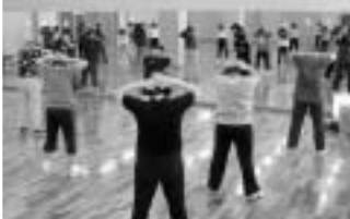
▲さわやかな汗が流れています。