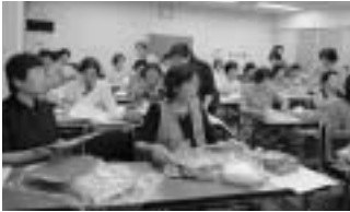
▲何ができるかわくわく