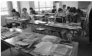
▲みなさん真剣です。