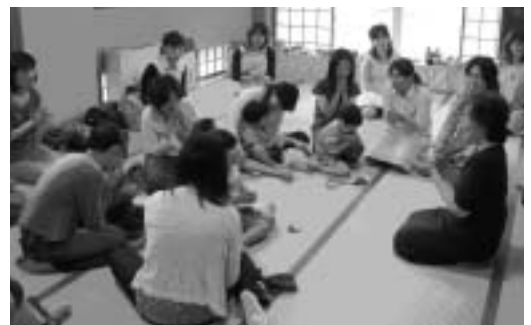
▲わらべうた教室の様子(6月実施)