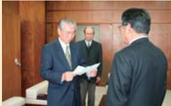
▲神崎市文化連盟会長(左)が目録を読まれる

神崎市文化連盟より、映画「がばいばあちゃん」上映会の益金の一部から、「市民の読書意欲を高めるため」に、10万円相当額の図書が寄贈されました。 ありがとうございました。