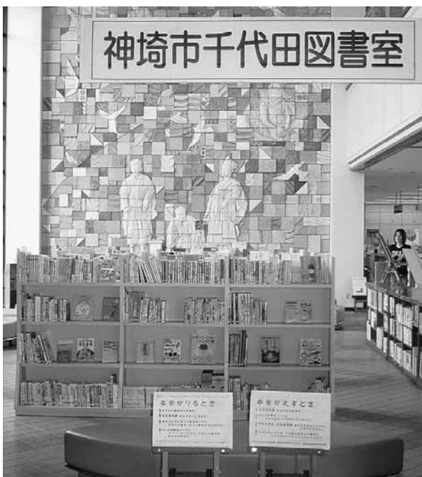
千代田庁舎の図書コーナー

市長 県から図書館の建設の要 望があったが、財政が厳しいの で保留している。この図書館 ネットワークシステムについて は、現予算で図書館に替わるも のが構築できるということで決 済した。しかし、論議のなかで 問題があるのなら解決すべきで ある。