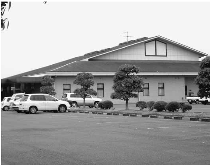
みやき町火葬場「しらさぎ苑」