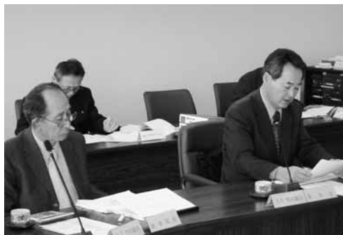
平成20年度予算特別委員会