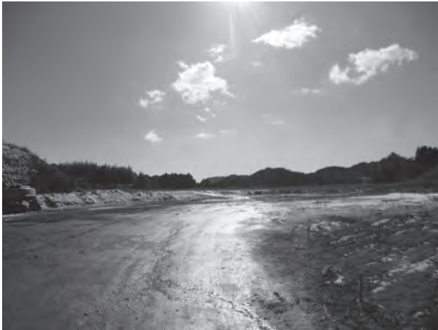
勝陣の土取り場（脊振町広滝地区）