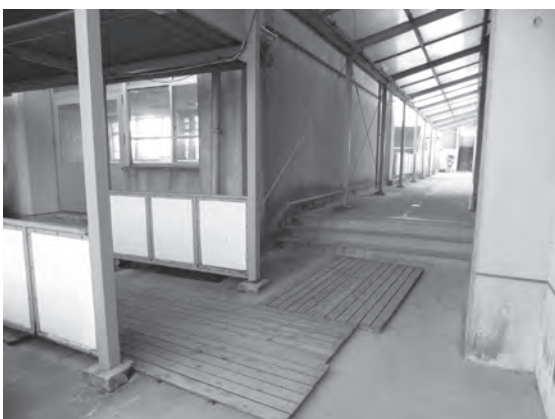
渡り廊下の段差（千代田中学校）