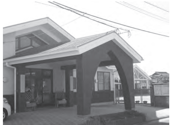
子育て支援対策の推進

A 運動場は問題ない。駐車場は、現在借用されているのでその拡充を検討されている。