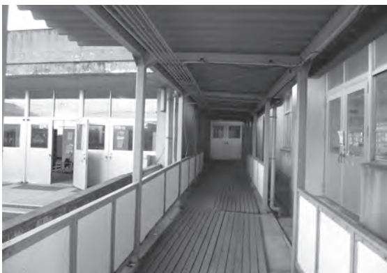
体育館への渡り廊下（千代田中学校）

車椅子を必要とする生徒が、学校生活を支障なく送るための校内の障害者用トイレの改修、移動を容易にするための段差解消工事を行う。