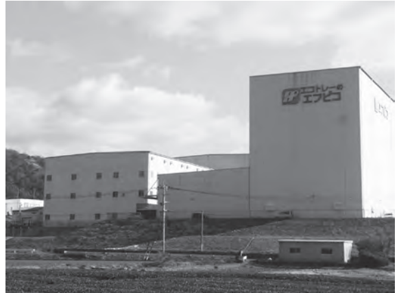
障害者の就労支援企業