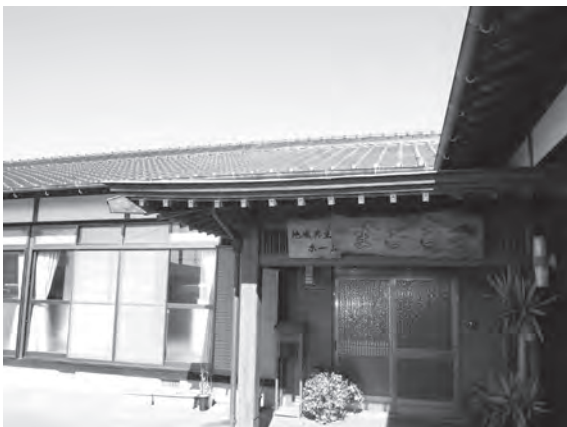
地域共生ステーションの推進

地域において高齢者・障害者・児童等、誰もが自然に集い、住み慣れた地域のなかで安心して暮していくことができようにするため、介護や子育て、生活支援など、多様なサービスを提供するとともに、協働するまちづくりの拠点ともなり得る場所づくりの推進に資するため、地域共生ステーション（宅老所・ぬくもいホーム）を整備する団体（法人・会社組織）等に、その整備費に対する補助金を交付する。