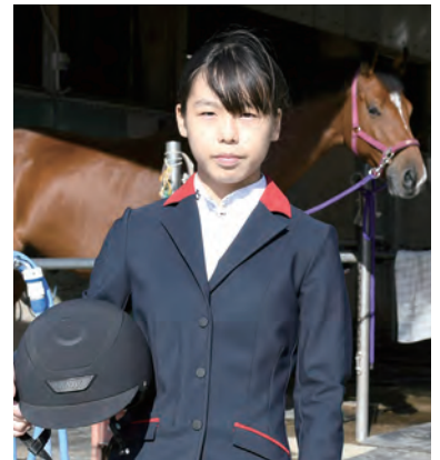
強化指定選手 馬術競技(障害飛越・少年)

佐賀県の「SAGAスポーツピラミッド構想」は、全国、世界で活躍する可能性のある選手を「スポーツエリートアカデミーSAGA」の支援対象選手とし、その中でも佐賀県で開催される第78回国民スポーツ大会(SAGA2024)で主力となり得る選手を「強化指定選手」として認定しています。「Good Luck!!」では、県から「強化指定選手」として認定を受けた選手たちをご紹介します。