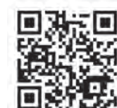
▲エントリーサイト