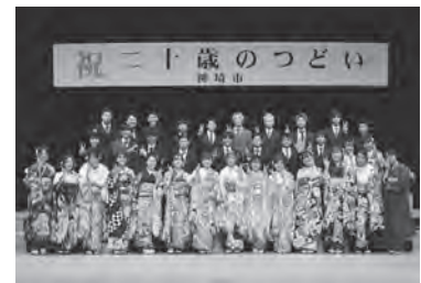
▲昨年の二十歳のつどい