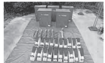
▲消防用資機材の整備