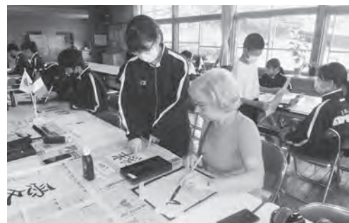
▲脊振中学校生徒との交流