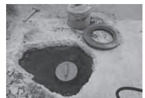
▲埋められた公共マス