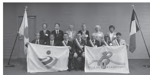
▲市庁舎での表敬訪問

両市の友好姉妹都市関係は平成8年に旧脊振村時代に始まったもので、市政発足後3度目の代表団の訪問は、さまざまな交流を通して今後の両市の友好を深める好機となりました。