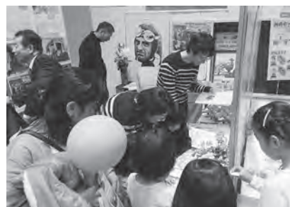
▲市イベントでの交流の展示紹介