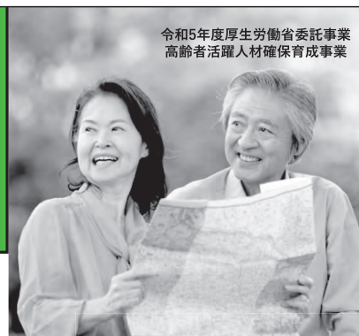
令和5年度厚生労働省委託事業 高齢者活躍人材確保育成事業

TEL 0952-20-2011 FAX 0952-20-2015 佐賀県シルバー 検索