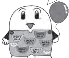
わくわくポケットくん