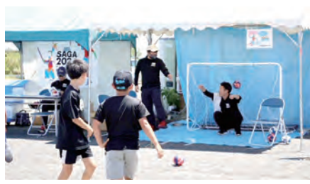
ハンドボール体験