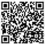
↑ 佐賀広域消防局 ホームページ