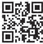
▲大会ホームページ