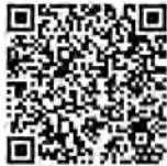
↑ 佐賀広域消防局 フェイスブック