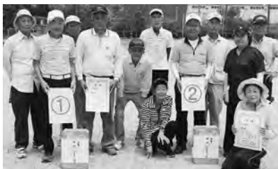
1パート優勝 黒津地区(左) 2パート優勝 餘江地区(右)