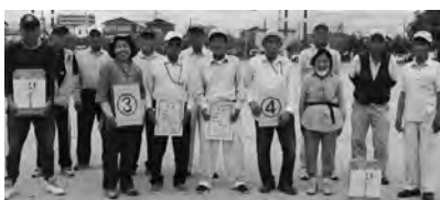
3パート優勝 川崎地区(左) 4パート優勝 本堀地区(右)