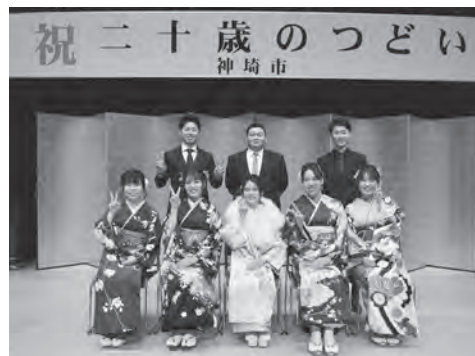
▲過去の二十歳のつどい

二十歳のつどいの実行委員として企画、運営に協力していただける人を募集します。希望者は、お問い合わせください。