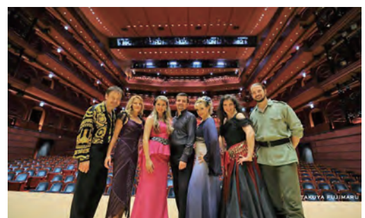
▲スロヴァキア国立オペラ団員

※応募者多数の場合は、抽選後返信用はがきに座席番号を記入し、9月10日をめどにお知らせします。