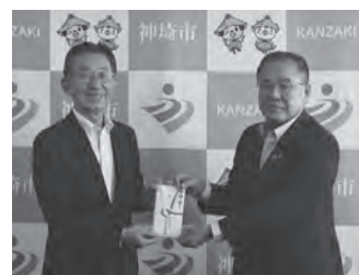
寄付金受納式の様子

いただいた寄付は3大夏祭りイベントや吉野ヶ里ロードレースなどで有効的に活用させていただきます。