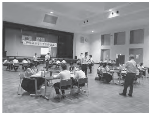
▲中学生サミットの様子

話し合った内容は①本年度の活動方針について②3校で共通して取り組む活動（無言清掃、行事革命、3R）の計画・状況でした。②については、グループ協議を行いました。各校の具体的な取り組みについて耳を傾け、内容について具体的に質問する様子が随所に見られました。時おり、驚きの声上がるなど和気あいあいと協議が進み、他校の生徒との親睦も深まったようです。生徒の皆さんの話し合いの仕方、発表や聞く態度がとても素晴らしかったです。