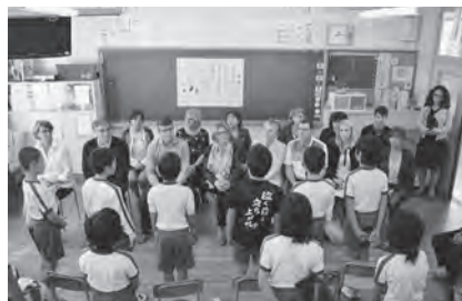
▲ボークール市代表団の学校訪問