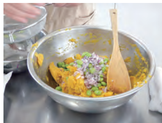
調理中のかぼちゃとさつまいもサラダ