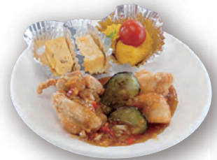
神埼清明高校の生徒考案のエール弁当（試作）