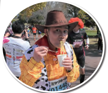
吉野ヶ里の応援は華やかで、神埼そうめん、いちごさんがとても美味しかったです