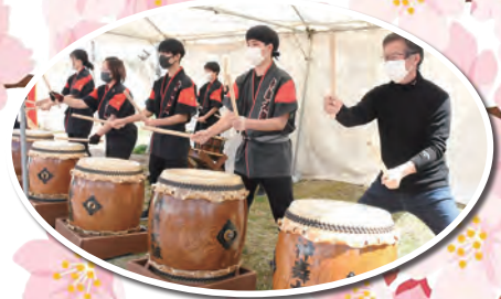
沿道の応援に感動しました！