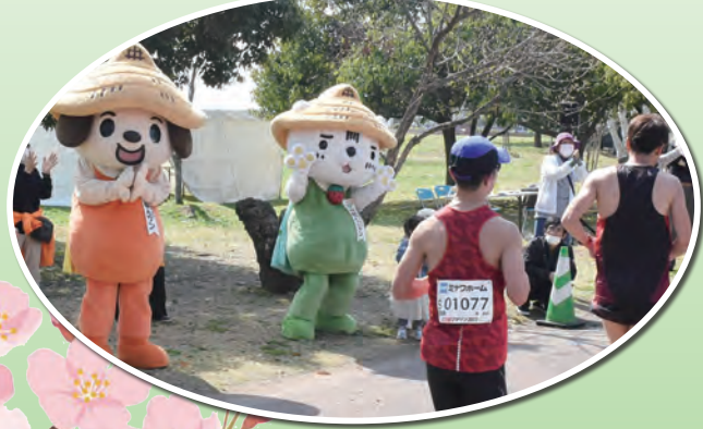
ボランティアのみなさん、心温まるご声援ありがとうございました！