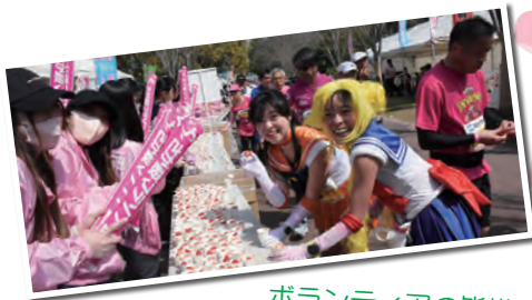
ボランティアの皆様、地元の皆様、ありがとうございました！