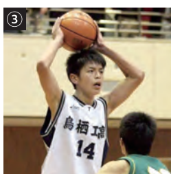
②神埼小ミニバスケットボールクラブ時 ③鳥栖工業高校時

身長186cmで5人制でのポジションはフォワード。一方、3人制は攻守に秀でたオールラウンダーが集う舞台で、攻守の切り替えが早く、常時走り回り、体を張って相手をマークするなどさらにハードな競技。昨年はレオブラックス佐賀で、海外チームも含めたプレミアリーグ・ファイナルに進出して5位に。「プロ選手も多く、バスケットボールに人生をかける気持ちの強さに触れて勉強になった」と言います。 県内開催の国スポ競技（5人制）に向けて「県チームは身長があまり高くない分、走り回って戦わなければ。デイフェンスの強度を上げるなど強化が必要」と見ます。個人としても「一人一人の力量アップがチームの成長につながる。あと2段階ぐらいプレーの質を高めたい」と考えて自宅でもトレーニングを続けます。「小学生の頃からバスケットボールを通じて育ててもらってきた。一つでも多く勝ち上がることが恩返しになると思っていますので、しっかり準備して臨みたい」と意気込んでいます。