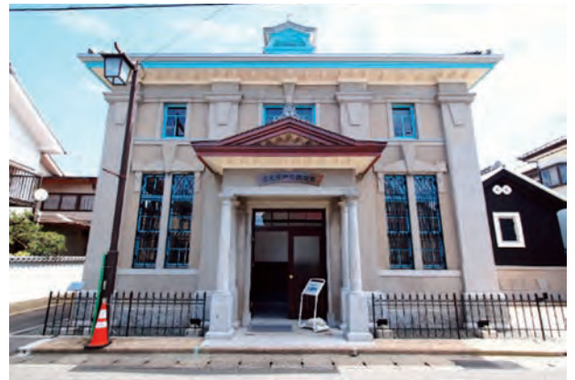
会場 旧古賀銀行 神埼支店