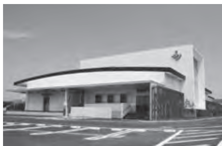
神崎市学校給食共同調理場