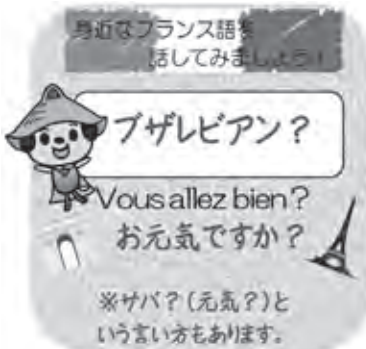
【情報提供】ポークール市 【参考資料】フランス大使館ホームページ