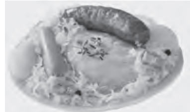
ソーセージを使用したフランスの郷土料理「シュークルート」