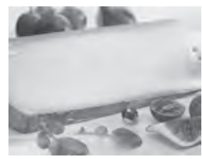
フランシュコンテ地方の名産「コンテチーズ」