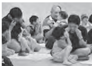
※昨年アバンセで実施の様子

子どもとの関わり方などについても、実践を交え楽しく教えていただきます。お子さんと一緒に、ご参加ください。