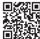
神崎市防災メール登録 QRコード

携帯電話への防災メールは、神崎市の緊急情報を市外にいても受信できます。神崎市外の方でも登録可能ですので、親戚や知人の方にもお知らせください。 ※携帯電話の受信状態によっては受信できない場合があります。