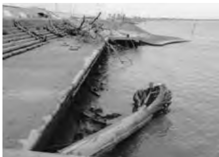
千代田町黒津地区 千歳漁港

たくさん流木による被害は、広範囲にわたりました。現に、千代田町黒津地区の千歳漁港にも大きな流木が漂着し、除去作業に予想を超える労力を必要としたと聞き及んでいます。