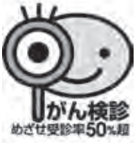
がん検診 めざせ受診率50%超