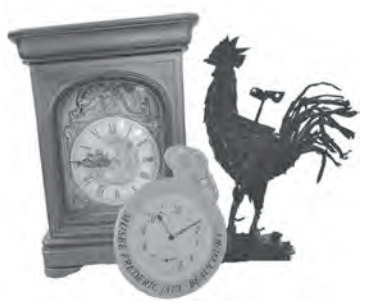
ボークール市から贈呈された時計・時計雑貨(左)。街の中心にあるシンボル、コック・ジャッピー(右) 【情報提供】ボークール市