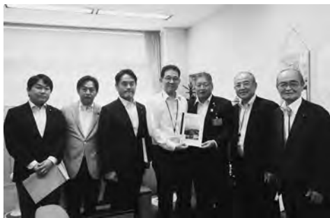
国交省水管理・国土保全局への要望

応に追われる状況であったため、陳情を無期延期しました。しかし、一日も早い城原川の治水対策の実現を願い、県東京事務所を介して国交省と調整し、7月27日に初めての陳情を行うことができました。