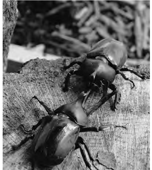
沢山のカブトムシと触れあおう！ 海外のカブトムシもいるよ！

○草木染体験 8/11(金・祝)～15(火) ◎場所：古代植物館 ◎時間：①10:00～16:00 ◎受付：当日受付 ◎参加費：500円～ ◎定員：各日先着30人