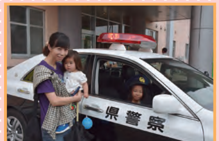
パトカーと一緒にハイチーズ!