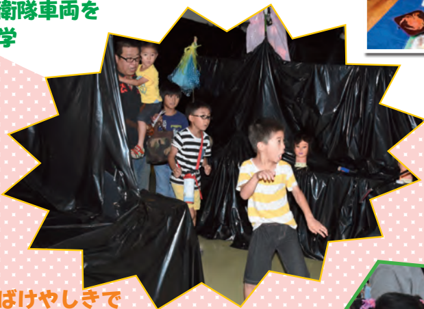
おぼけやしきでびっくり