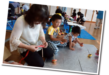
子どもたちもボランティア