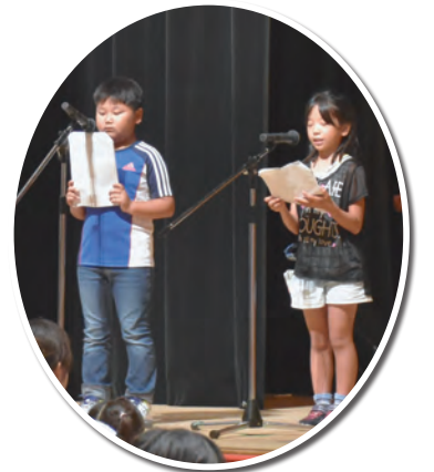
司会も子どもたちで

子どもまつりは市内の約50団体でつくる実行委員会が企画、470人のスタッフが運営にあたり、小中学生もボランティアとして活躍しました。