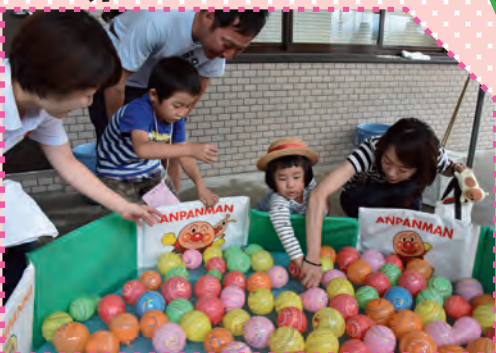
楽しくスタンプ集めも