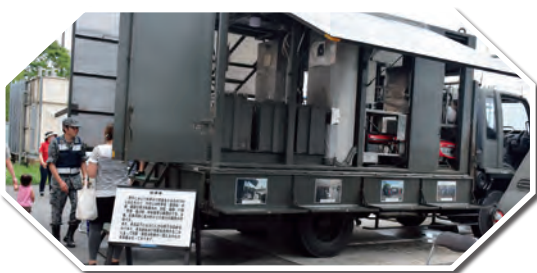
自衛隊車両を見学