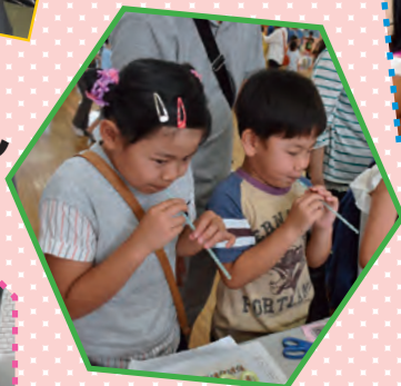
楽しいコーナーがたくさん