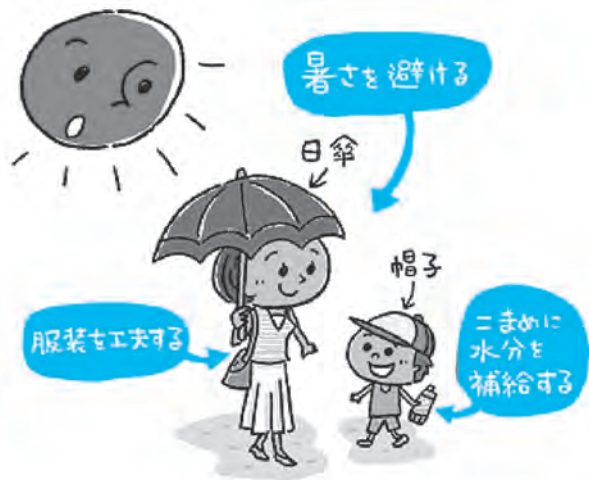
「政府広報オンライン」より

人の体は、暑い環境での運動や作業を始めてから3〜4日経たないと体温調節が上手になってきません。急に暑くなった日や活動の初日などは、特に注意が必要です。