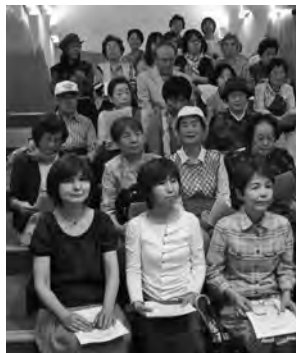
▲おはなしのほりがまのへや

6月18日に市内読みかたりボランティアの皆さんが、全国的にも有名な伊万里市民図書館への視察研修に行きました。伊万里の図書館ボランティアの皆さんとの交流も行い、これからの図書館を考える良い機会となりました。