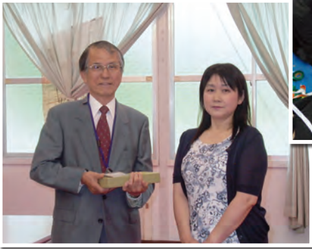
▲募金の贈呈の様子

今年で18回目を迎えた子どもまつりが、5月29日に神崎市中央公民館など3カ所を会場に開かれました。この日はあいにくの雨で、屋外イベントは中止になりましたが、親子連れなど約1,500人が参加、楽しい時間を過ごしました。