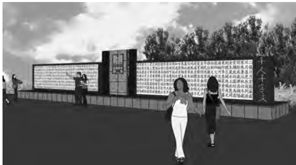
▲千字文モニュメント