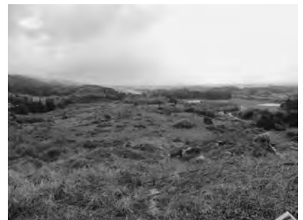
▲土採り場跡地内部 現況

計画炉数は予備炉を含め4炉になります。神崎市・吉野ヶ里町における火葬件数のピーク前となる平成51年までは、3炉で対応可能ですが、ピークとなる52年に向けて設備の更新等もふまえ4炉目の検討を行います。