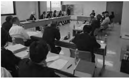
▲神崎市・吉野ヶ里町葬祭公園整備促進協議会の様子

◆葬祭公園整備の背景 火葬場は、人生終焉の地をいただく場として住民の誰もがお世話になる施設ですが、現在、神崎市、吉野ヶ里町にはそれぞれ火葬場がなく、隣