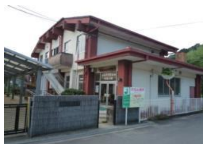
脊振2000年館（市立図書館脊振分館）