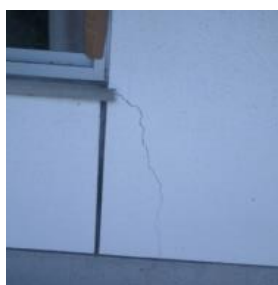
脊振診療所の亀裂